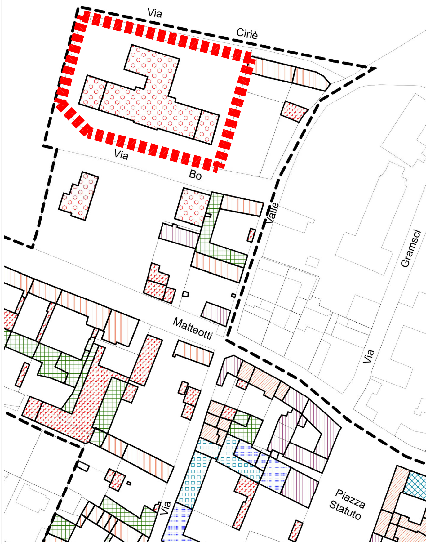
ESTRATTO P.R.G.C. Scala 1 : 1.000 TAVOLA n° 9/5vp/1vs CENTRO STORICO - TIPOLOGIE EDILIZIE Cs9 EDIFICI E COMPLESSI EDILIZI DESTINATI AD ATTREZZATURE DI SERVIZIO E/O DI USO PUBBLICO DI RECENTE COSTRUZIONE