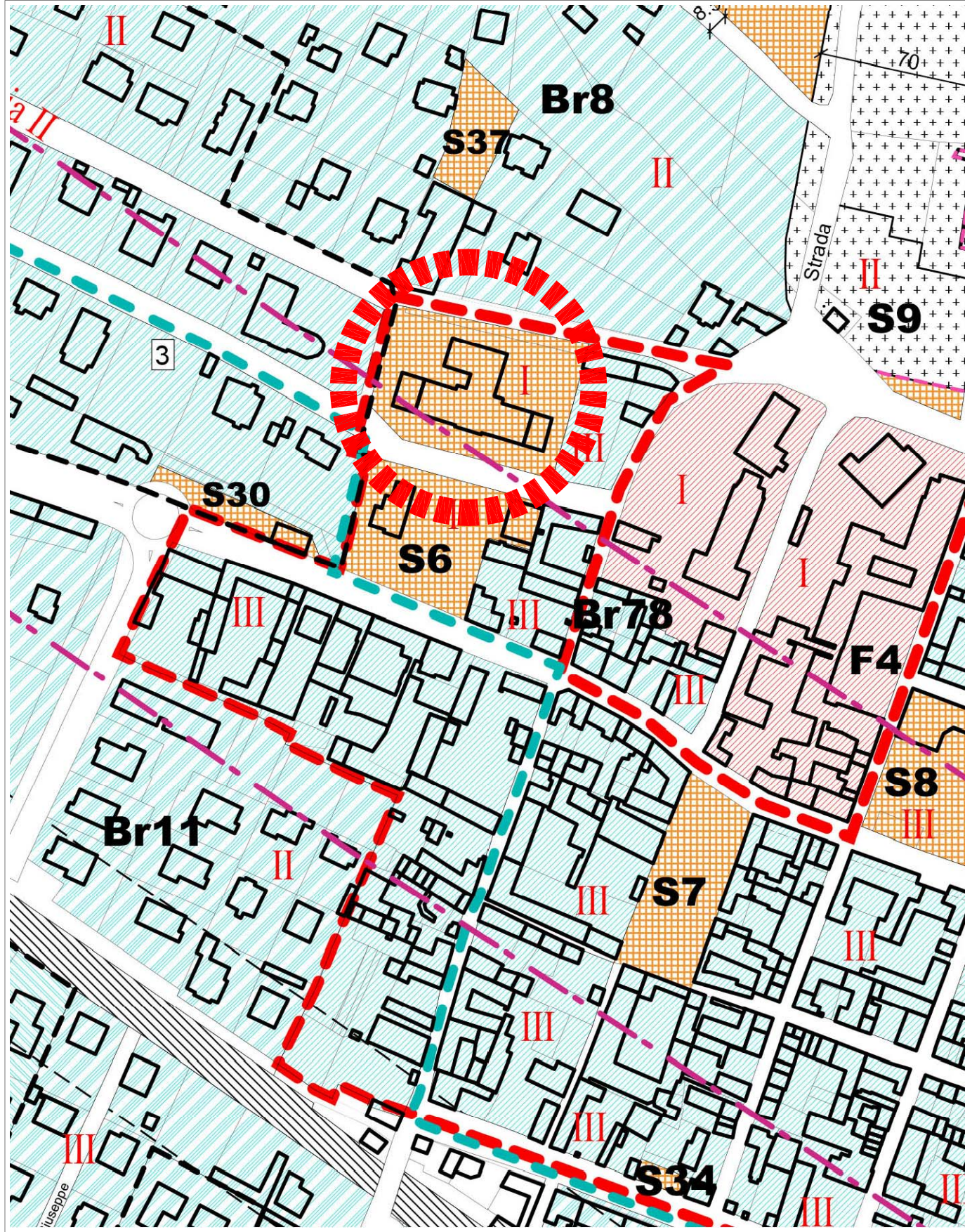
ESTRATTO P.R.G.C. Scala 1 : 2.000 TAVOLA n° 12/5vp/1vs AZZONAMENTO E VIABILITA' CONCENTRICO Zona normativa: S6 (Servizi)